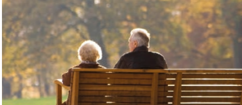
Zorgen voor jong en oud p. 2