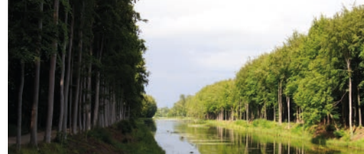
De metamorfose van Tervuren p. 3